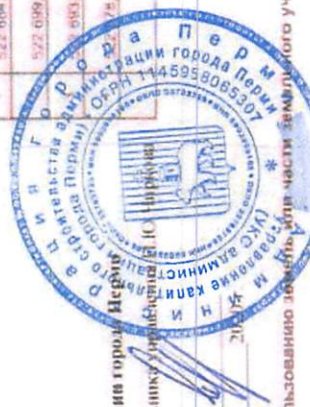
Схема предполагаемых к использованию земель для части земельного участка

Объект: Автомобильный проезд для объекта «Строительство здания для размещения дошкольного образовательного учреждения по ул. Евгения Пермяка, 8а» Местоположение: Пермский край, г. Пермь, ул. Евгения Пермяка, севернее земельного участка с кадастровым номером 59 01 3919167 3545 Площадь земельного участка: 260,5 кв.м. Категория земель: земли населенных пунктов Вид разрешенного использования: Проезды, в том числе автомобильные, и подъездные дорожки, для размещения которых не требуется разрешение на строительство.